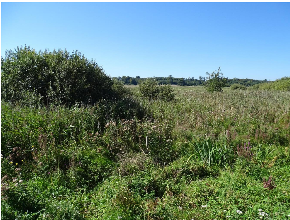
Ved Sadelmagermose findes arter som kattehale ( Lythrum salicaria ), smalbladet dunhammer ( Typha angustifolia ) og gul iris ( Iris pseudacorus ) i konkurrence med mere dominerende arter som lådden dueurt ( Epilobium hirsutum ), tagrør ( Phragmites australis ) og pil ( Salix sp. ).