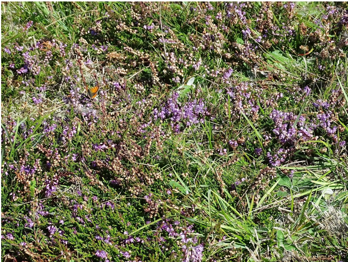
Skrænt ved Langemose med håret høgeurt ( Pilosella officinarum ), hedelyng ( Calluna vulgaris ), og fødesøgende lille ildfugl ( Lycaena phlaeas )