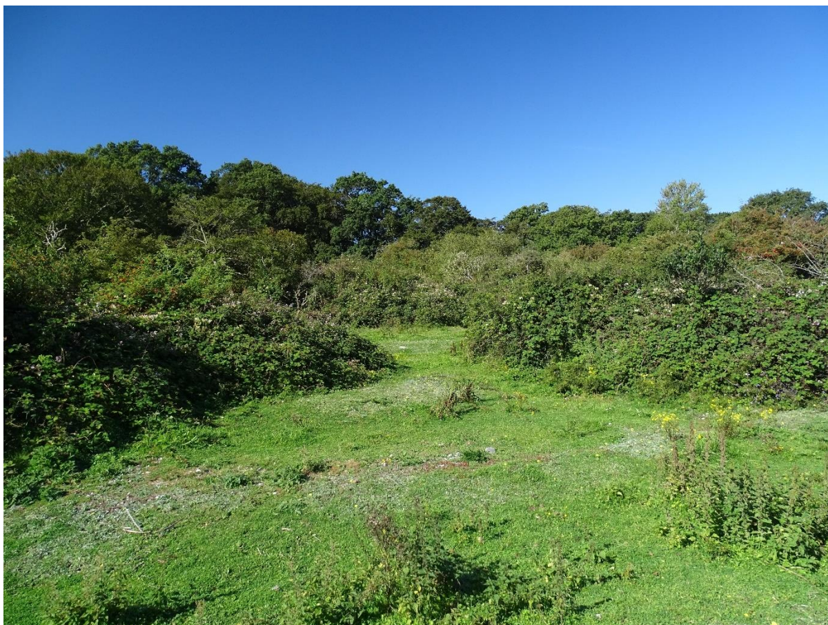
Strandeng ved Bøgebjerg tilgroet med brombær ( Rubus sp. ) og slåen ( Prunus spinosa ).

***** Rydning af invasive arter har ikke været en prioriteret indsats i første planperiode for skovbevoksede, fredskovspligtige arealer, hvorfor det ikke er muligt at angive et areal for, hvor der er igangværende indsatser fra første planperiode (2010-21).