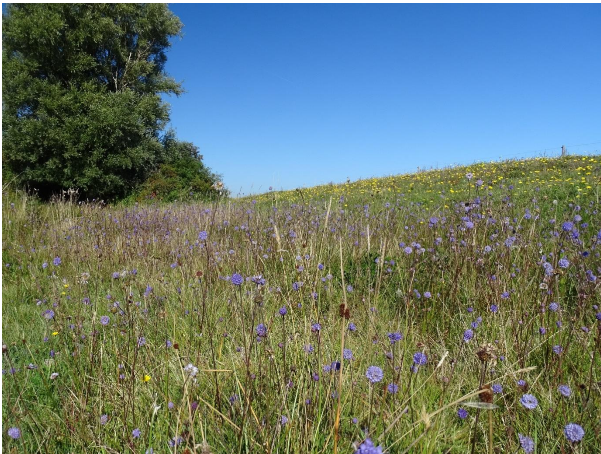
Langs Langemose løber en lang bræmme med en stor bestand af djævelsbid ( Succisa pratensis ).